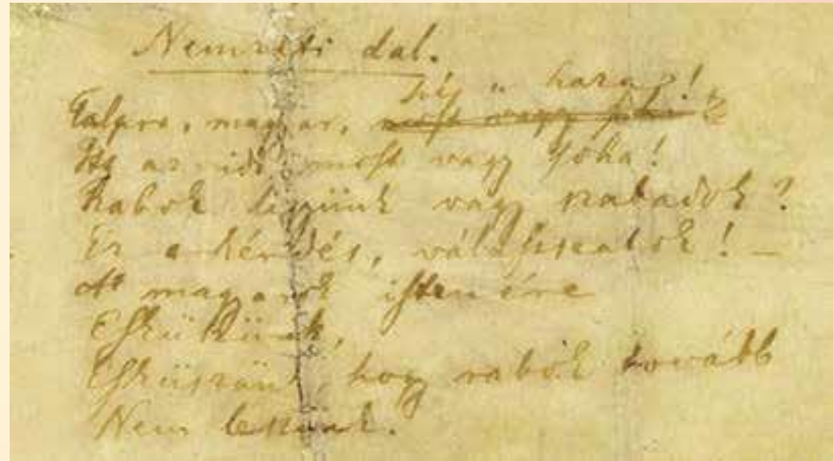
A Nemzeti dal eredeti kézírata. Ki írta?