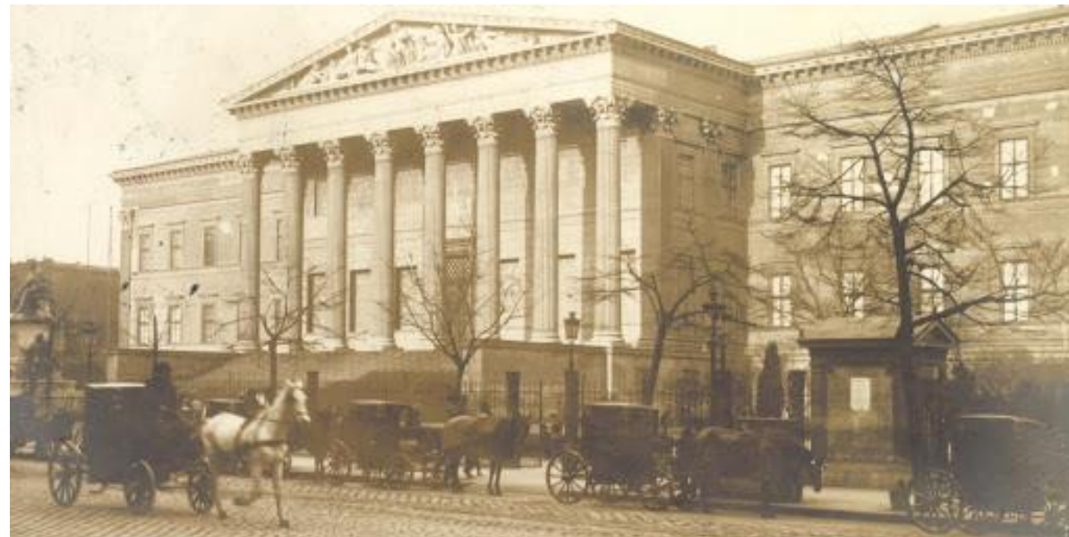
Magyar Nemzeti Múzeum