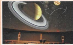
A budapesti Planetáriumban az égbolton látható jelenségeket modellezik.

A fővárosban és a nagyobb városokban sok olyan helyre látogathatsz el, ahol tudásodat és ügyességedet gyarapítva szórakozhatsz.