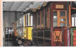
Budapesten a Közlekedési Múzeumban számtalan régi és újabb közlekedési eszközzel ismerkedhetsz meg.