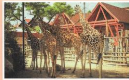
A Fővárosi Állat- és Növénykert Magyarország legrégibb és a legnagyobb gyűjteményű állatkertje.