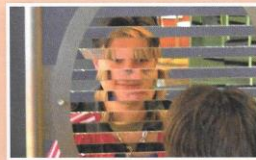
A fővárosban a Csodák Palotájában csodának tűnő dolgokat láthatsz. Ha teheted, látogass el ide!