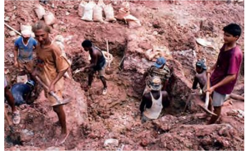
Kézzel fejtik a rézércet a bányában