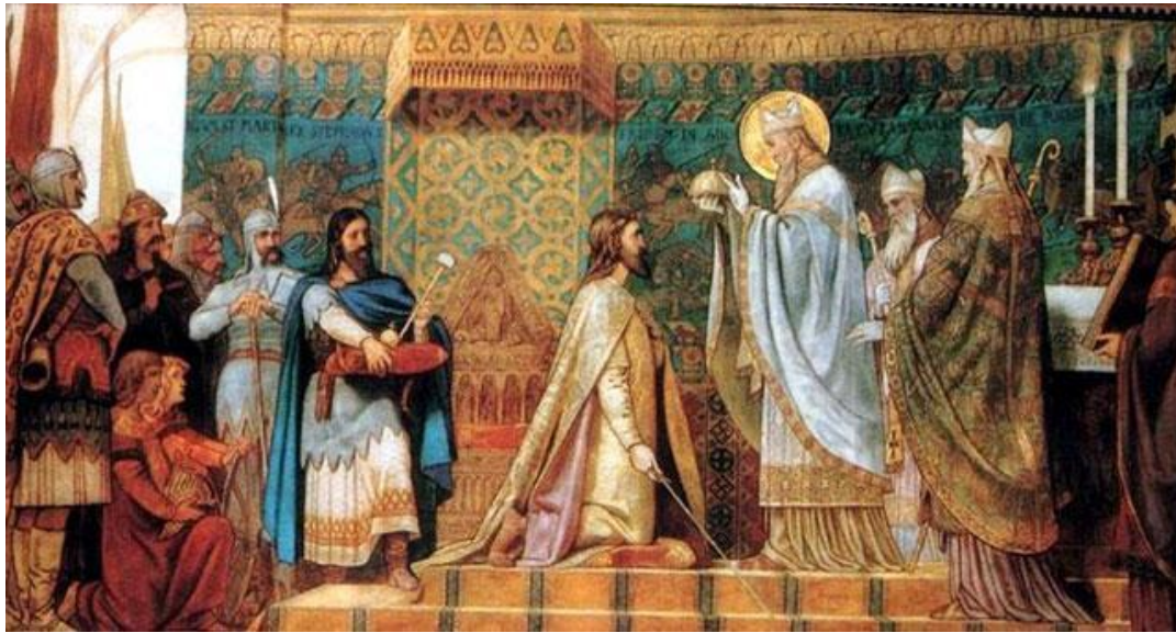
Székely Bertalan (1835–1910) festménye: I. András magyar király koronázása