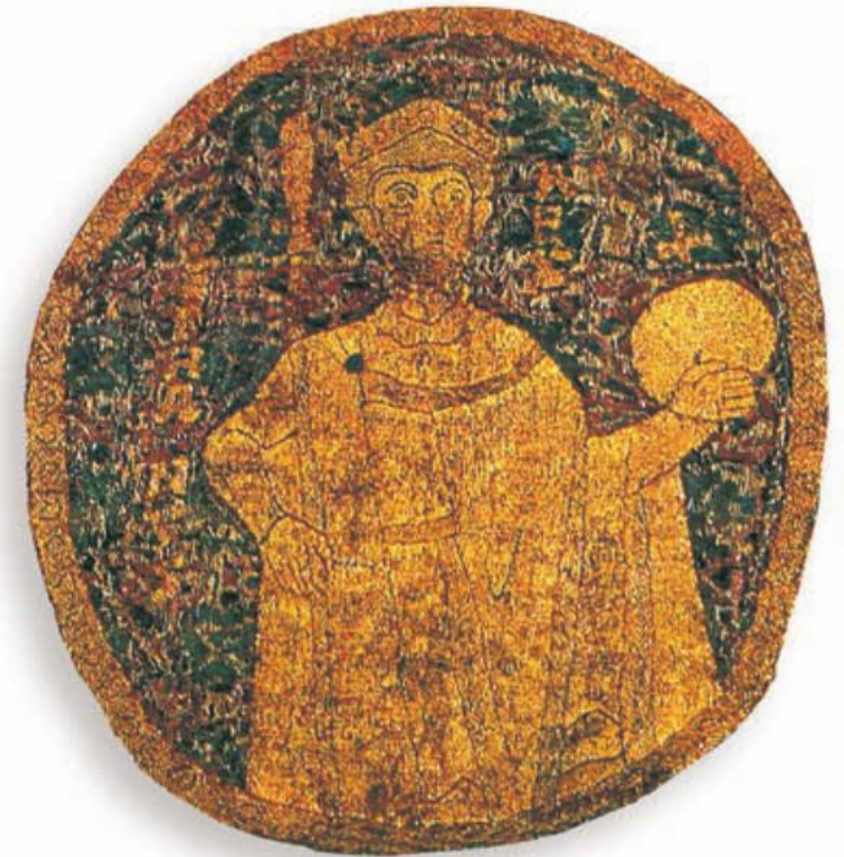
163.1. István ábrázolása a koronázási paláston. Figyeld meg a koronáját!