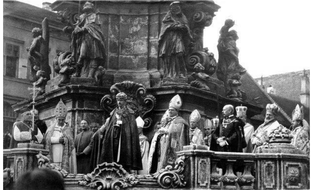
IV. Károly koronázása 1916-ban - Budapesten