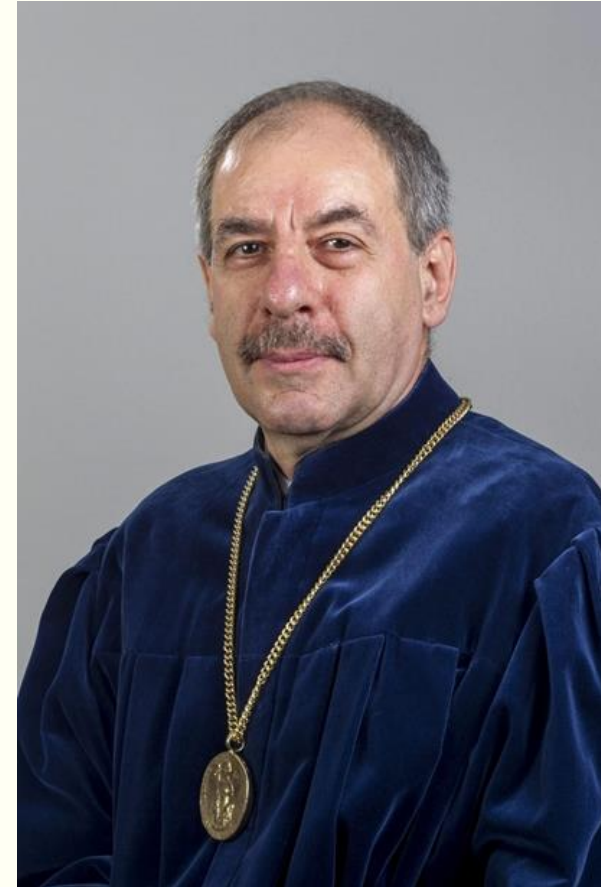
Dr. Sulyok Tamás, az Alkotmánybíróság jelenlegi elnöke