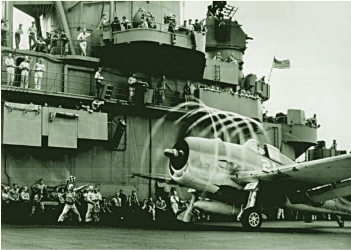
163.4. Repülőgép indítása egy amerikai hordozóról