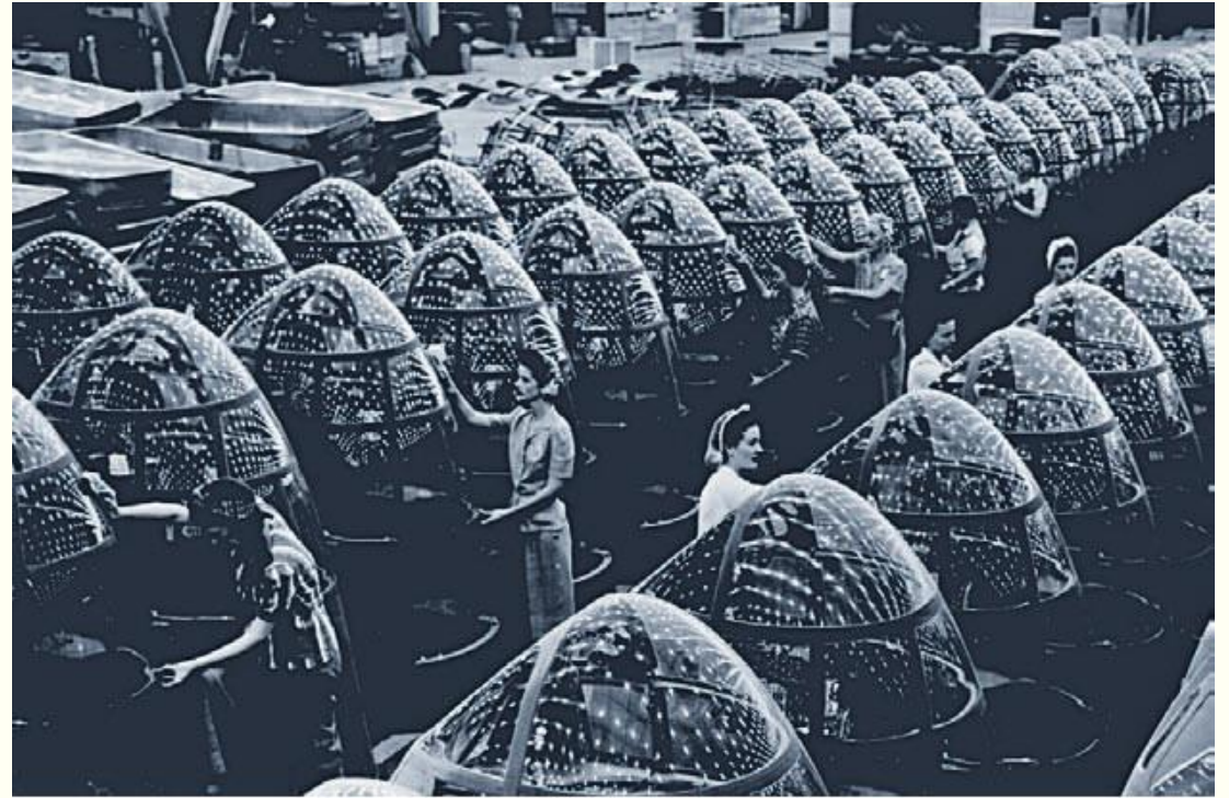
171.3. Repülőgépgyár az Egyesült Államokban. Kik dolgoznak a képen? Vajon miért?