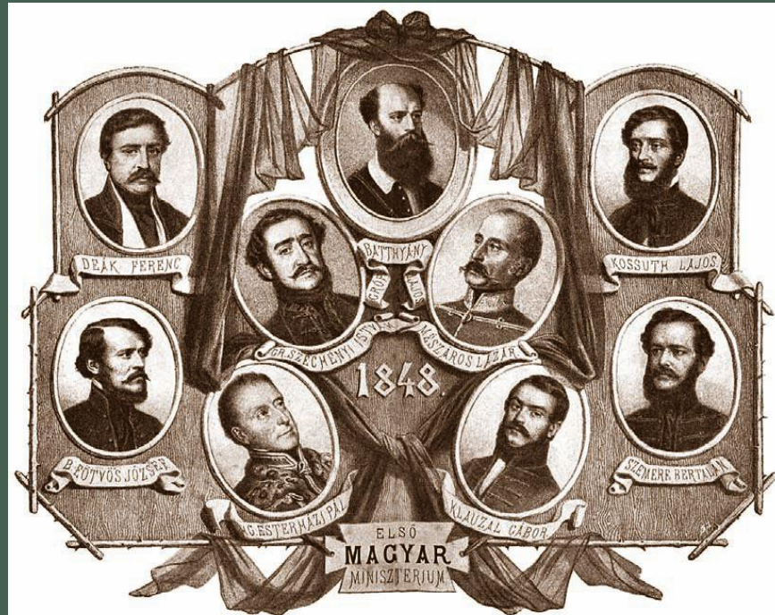
161.1. A Batthyány-kormány: Batthyány Lajos gróf miniszterelnök, Deák Ferenc igazságügy-miniszter, Széchenyi István gróf közlekedésügyi miniszter, Mészáros Lázár hadügyminiszter, Kossuth Lajos pénzügyminiszter, Eötvös József báró vallás- és közoktatásügyi miniszter, Esterházy Pál herceg király személye körüli miniszter, Klauzál Gábor földművelés- és iparügyi miniszter, Szemere Bertalan belügyminiszter