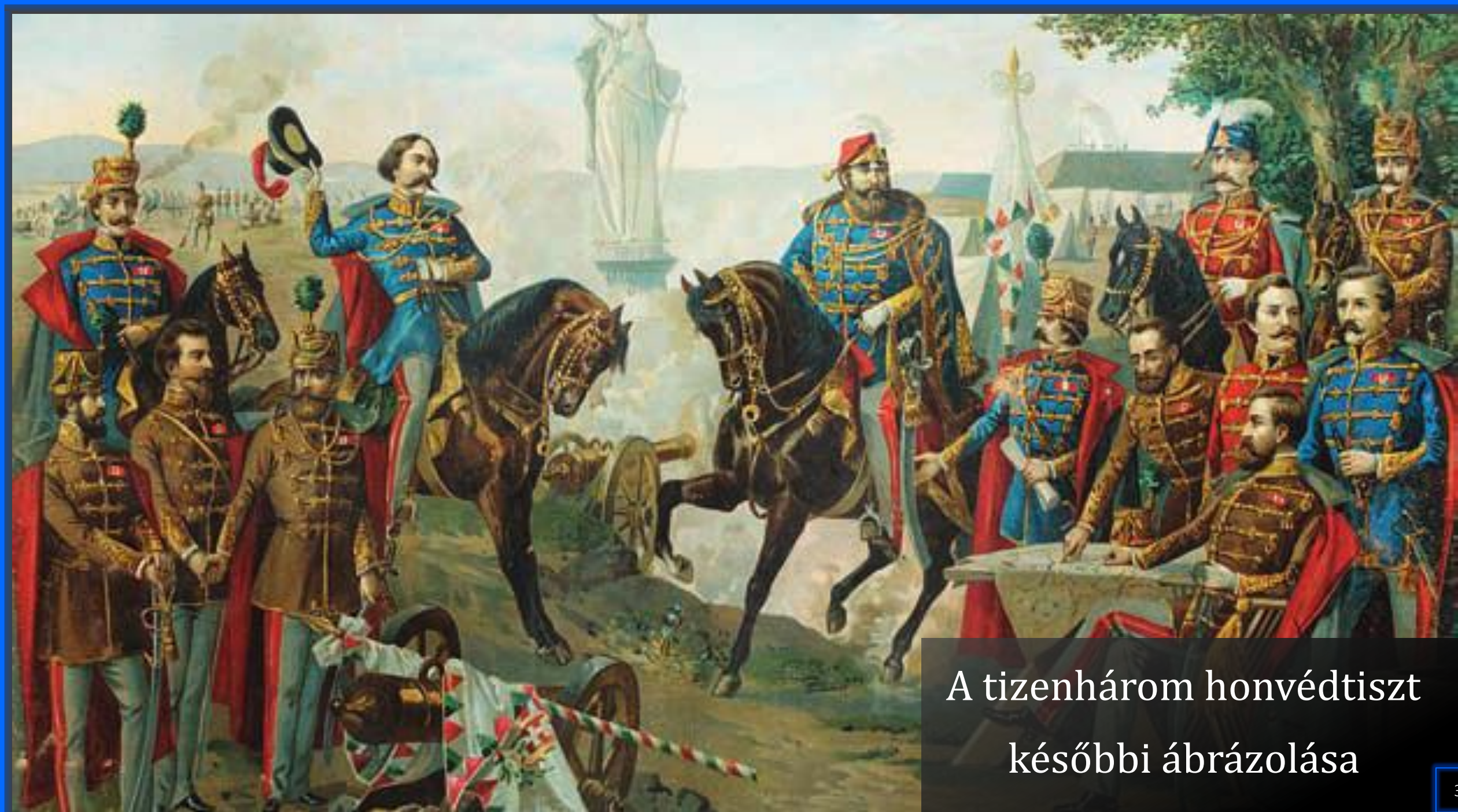
A tizenhárom honvédtiszt későbbi ábrázolása