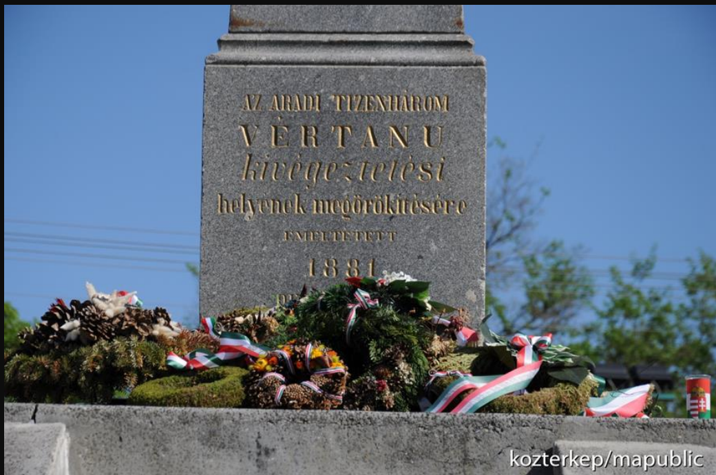
A vértanúk emlékműve Aradon