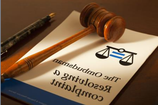
Európai ombudsman - Strasbourg