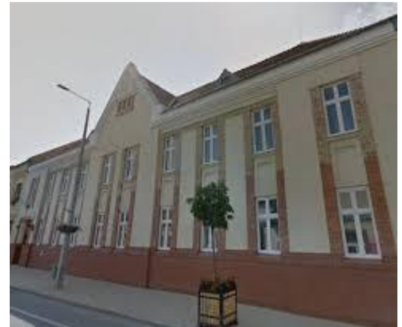
Mezőkövesdi bíróság épülete