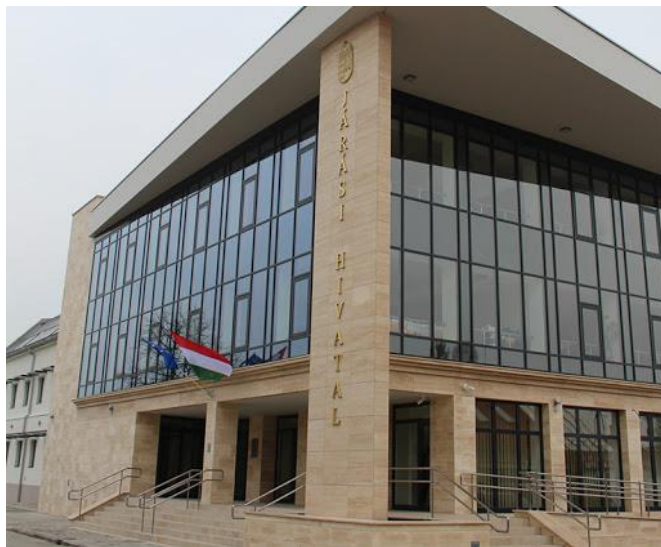
Mezőkövesdi Járási Hivatal épülete