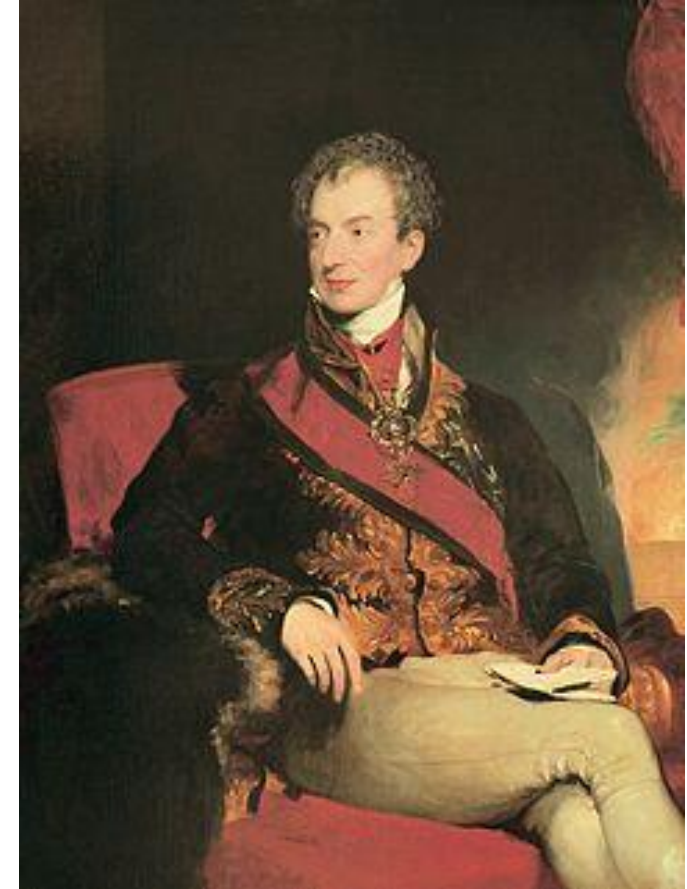
Metternich osztrák kancellár