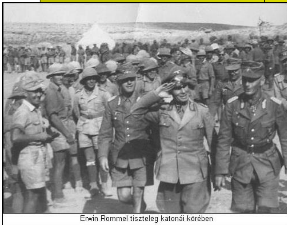
Erwin Rommel tiszteleg katonái körében